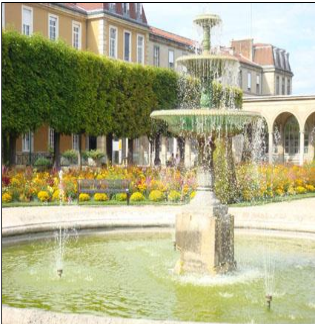
Hôpital Charles Foix